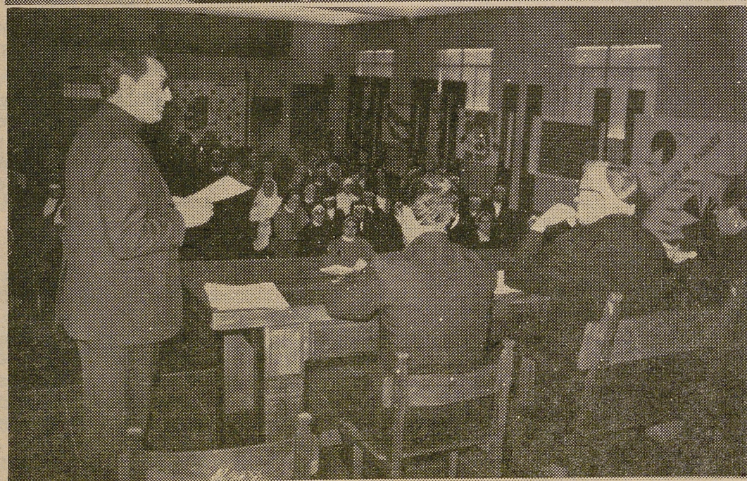
Dos momentos de los trabajos desarrollados en la cita Ecuménica que se ha desarrollado en nuestra ciudad, de cuya clausura damos información en la página 4.ª.