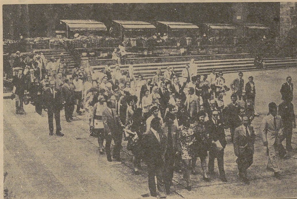
Un centenar de enamorados han partido desde Barcelona a la Playa de Aro, como ganadores del concurso "El amor se cita en la Playa de Aro" que cada año ofrece este viaje a parejas de novios de toda Europa.