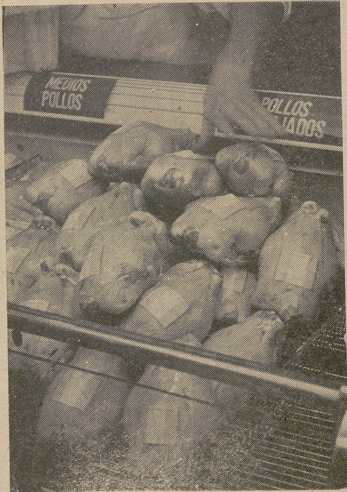
Tradicionalmente, el pollo fue considerado un plato exclusivo de las mesas opulentas; hoy se encuentra al alcance de todas las economías.