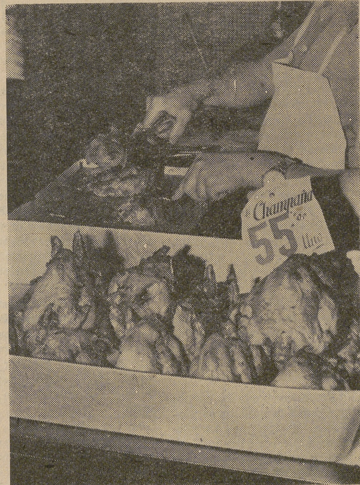
Hasta cien recetas distintas admite el pollo. Esta singular bondad culinaria evita que el comensal pueda sentir monotonía al degustar a menudo el mismo producto

Sin embargo, hay quien opina gratuitamente que estos llamados «pollos de granja» no tienen la carne tan sabrosa como los de —para usar una vez más la ya trasnochada y desacreditada muletilla— «antes de la guerra». Aparte de que se trata de un «sabor» que ya nadie recuerda, dicha opinión responde más a la nostalgia que a la realidad. Los nuevos sistemas de alimentación equilibrada, los alojamientos higiénicos, el control sanitario de las epizootias (que ha erradicado la peste aviar que tantas bajas causaba en la cabaña avícola) y los recientes descubrimientos de los ciclos genéticos, abonan su más óptima y