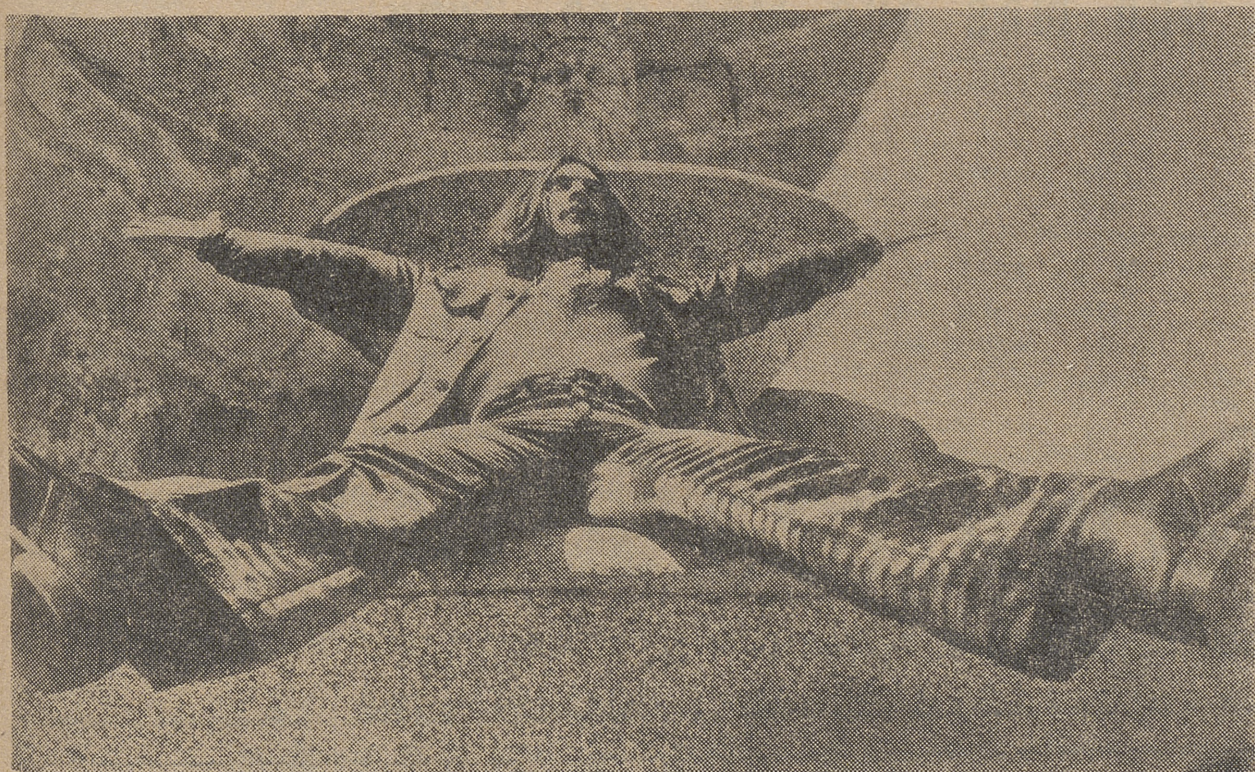
El drogadicto necesita el apoyo moral de todos.