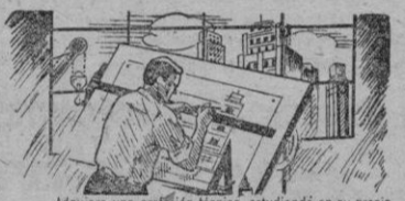
Adquiera una profesión técnica, estudiando en su propia casa, dirigido por expertos profesores. Nuestros acreditados Cursos por Correspondencia le permitirán adquirir el tan solicitado