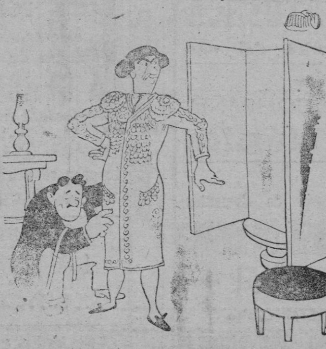
—(Muy bien. Este abrigo con alamares me permitirá tocar todas las corridas de invierno sin resfriarme.