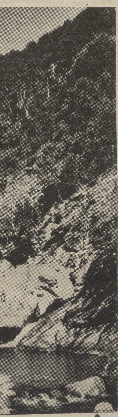
Las cuevas del Cerro del Aguila en Arenas, cuyo interior ha sido perfectamente acondicionado, e iluminado y que serán oficialmente inauguradas mañana.

—Bajen algún día por el pueblo; les va a encantar.