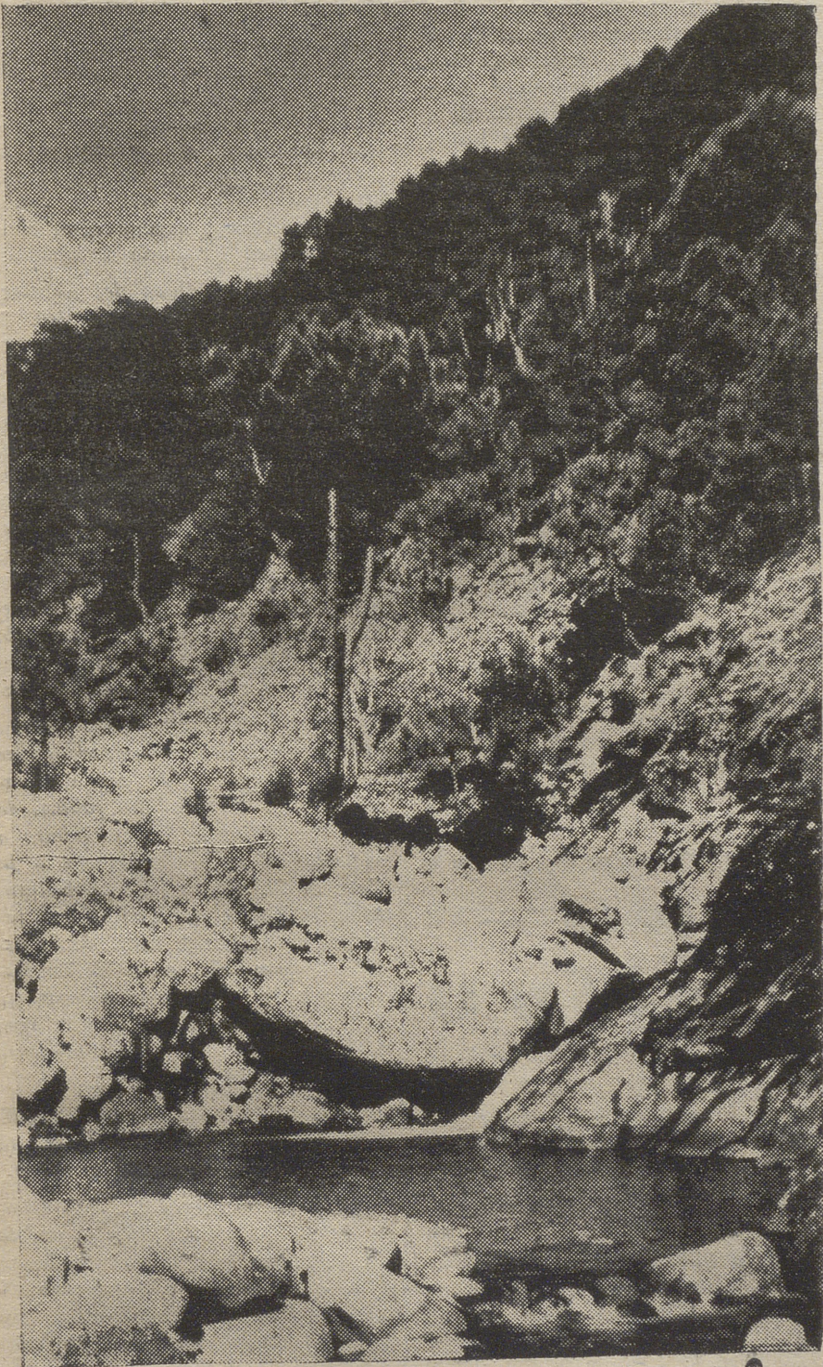
Guisando, al fondo Gredos. Paisaje maravilloso de nuestra Tierra de Avila.

Fueron unos días maravillosos a los pies mismos de las estribaciones de Gredos. Habíamos hecho cuantas excursiones pueden realizarse desde nuestro campamento, que son muchos, todas ellas con la singularidad del paisaje, con la emoción de la es-