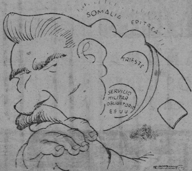
LA PRIMERA ERUPCION DE LA TEMPORADA