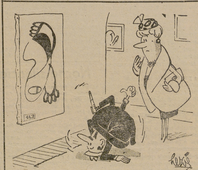
—Ahora es cuando empiezo a ver lo que representa ese cuadro...

...es más televisor DISTRIBUIDOR EXCLUSIVO Iberia García & San Frutos S.L. Avenida José Antonio, 22