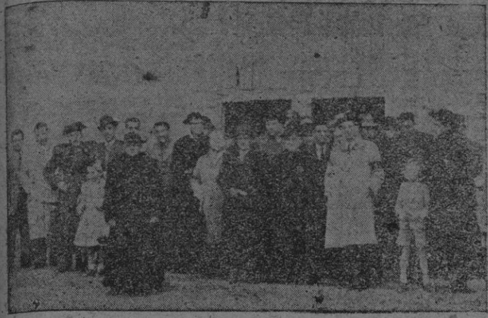
Grupo de Autoridades civiles, militares y eclesiásticas y algunos miembros de la U.A.M. a la salida de la iglesia donde se celebró la Misa Mayor en honor de San Antonio.