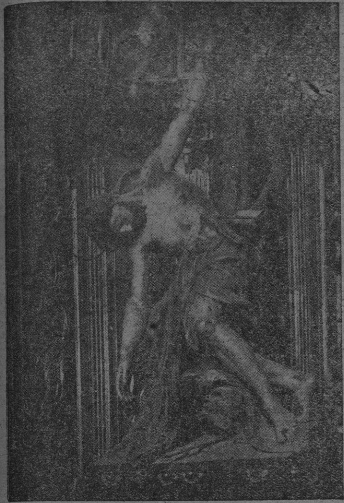
Magnífica imagen de San Sebastián, Patron de Palma, que se venera en la Santa Iglesia Catedral Basílica, donde se celebra hoy solemnisíma fiesta costeada por el magístico Ayuntamiento palmesano.

Miembros del "Haganah" recuperaron poco después parte del botín. Los irregulares cargaron las cajas que contenían los pitillos en varios camiones.