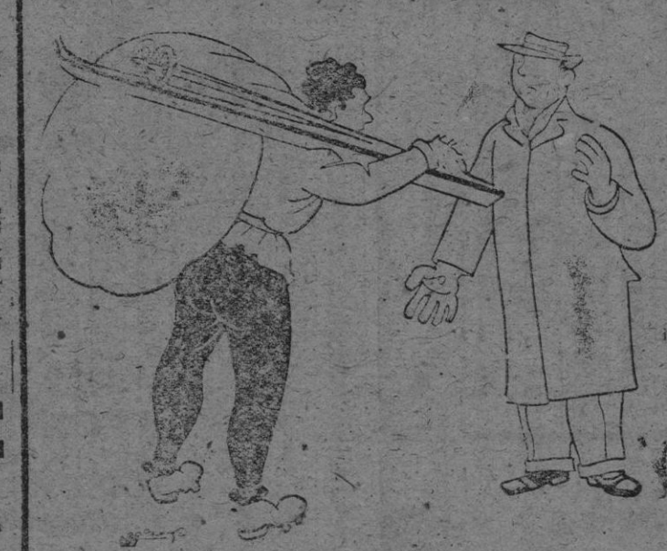
—ESO DE ESQUIAR CADA DIA SE PONE MAS DIFICIL. ESTE AÑO, ADEMAS DE LOS ESQUIS, LOS BASTONES Y EL EQUIPO, HE-MOS DE LLEVAR LA NIEVE.