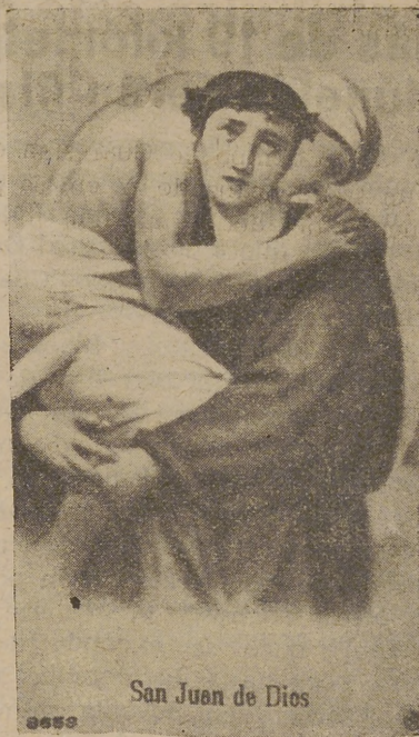
San Juan de Dios