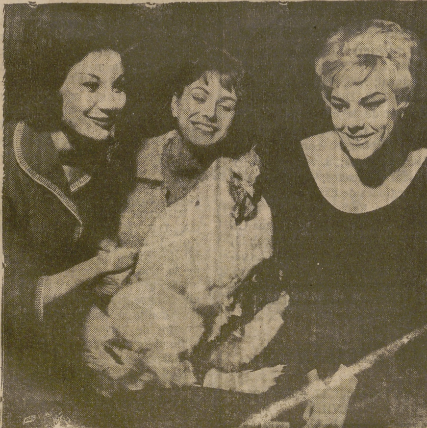
Estas tres jóvenes francesas libraron al gallo «Quiquiriqui» del arroz a que estaba condenado y le han criado con tal mimo que se ha desarrollado de modo fenomenal con nueve Kgs. de peso.

No deje nunca las cerillas... Son seguras, rápidas. ¡Y siguen premiando!