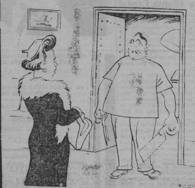
—NO, SEÑORA, NO, YO NO HAGO APUNTACIONES; YO HAGO AMPUTACIONES.