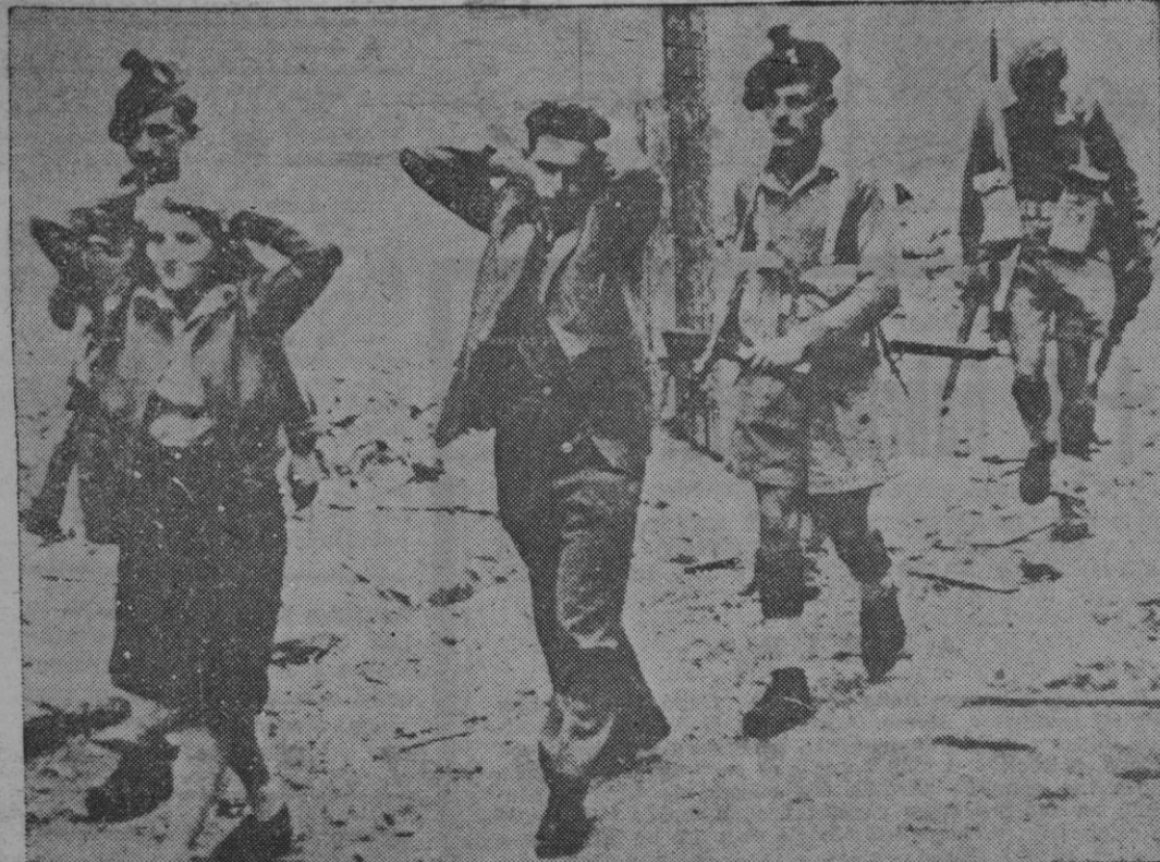
Este par de jóvenes, detenidos por soldados de la infantería escocesa destacados en Palestina, son dos miembros de la organización sionista «Haganah», los cuales serán sometidos a interrogatorio después del hallazgo de armas en un local de Ja'fa.