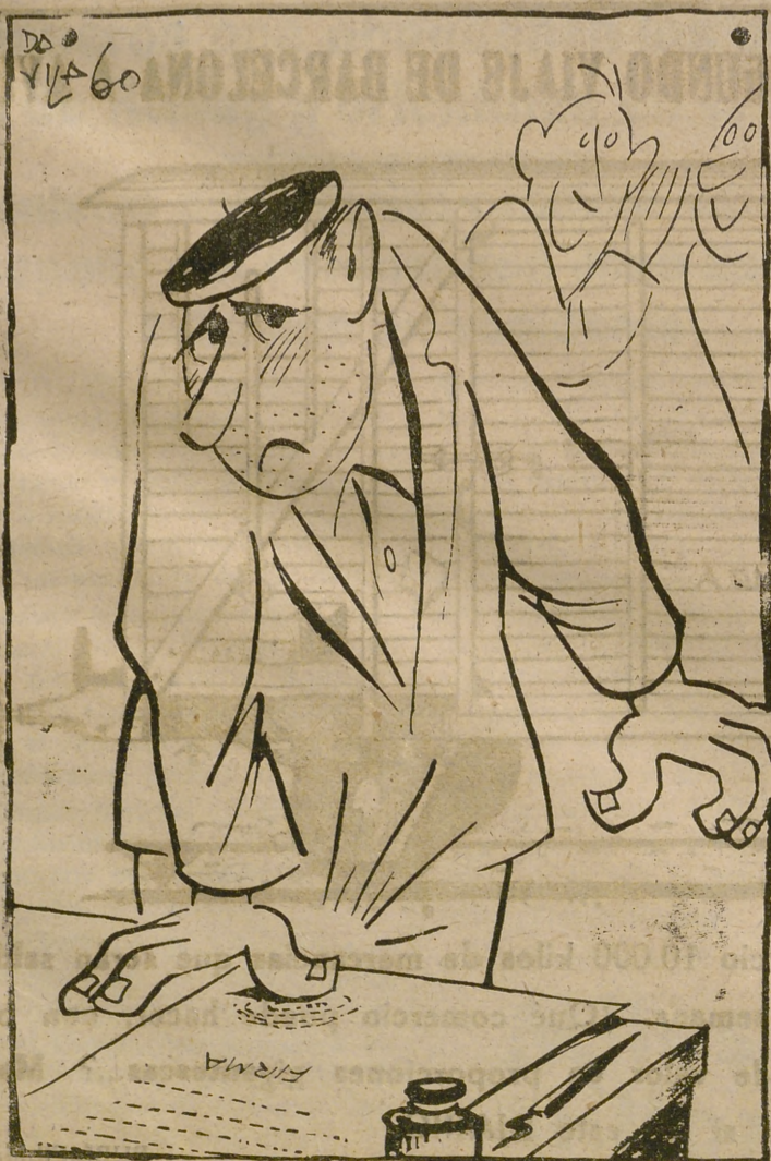
Analfabeto: No dejes huellas

Durante los nueve primeros meses del pasado año, abandonaron 3.587 familias agrícolas la zona soviética. La cifra de los artesanos e industriales independientes refugiados es aún más elevada. Abandonaron la zona sovié-