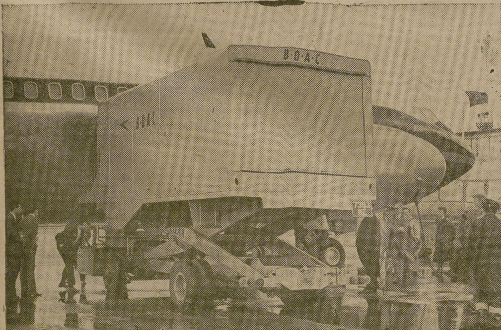
La «Douglas Cargomaster» cargadora de 11'5 toneladas, reduce los tiempos de carga de buques en un 50 por 100, y aparece aquí demostrando su eficiencia al cargar equipaje en un avión Boeing 707 Monarch, en el aeropuerto de Londres.