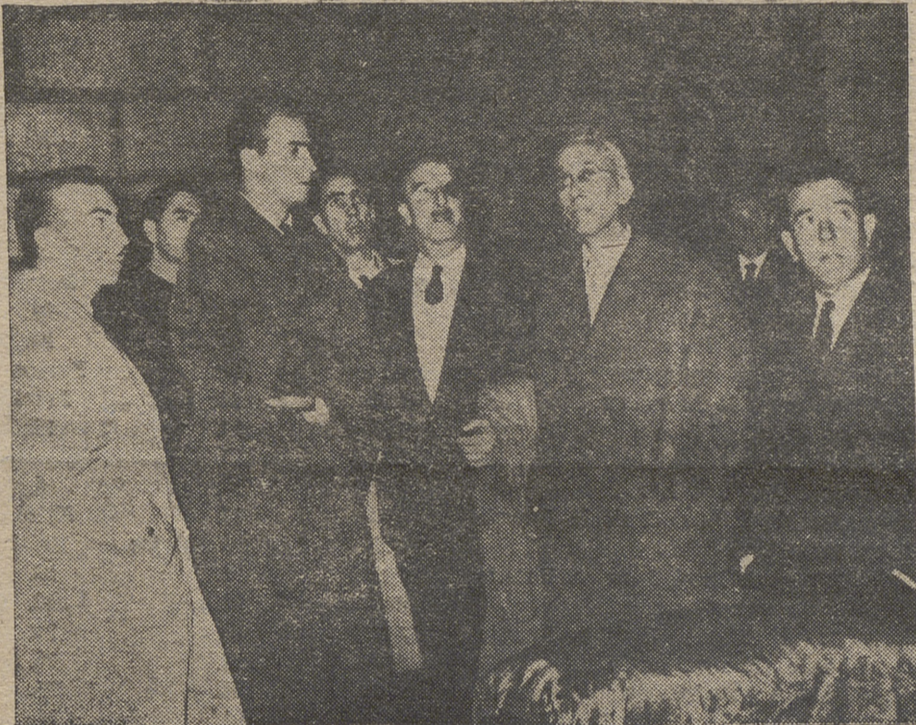
Un momento de la visita del Príncipe, don Juan Carlos a la casa natal de la Santa. De izquierda a derecha: el gobernador civil, S. A. R., el cronista de Avila, el alcalde y el presidente de la Diputación.