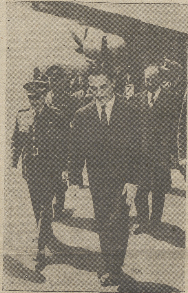
El pasado sábado, a las tres y cuarto de la tarde, llegó a Madrid, en avión, el Rey Hussein de Jordania. Venía desde Fez y le acompañaban personalidades de su Gobierno. En el aeropuerto de Barajas le recibió una comisión del Ejército español, diplomáticos y otras personalidades. El viaje a España de Hussein tiene carácter privado.

Llegó a Madrid el Rey Hussein de Jordania