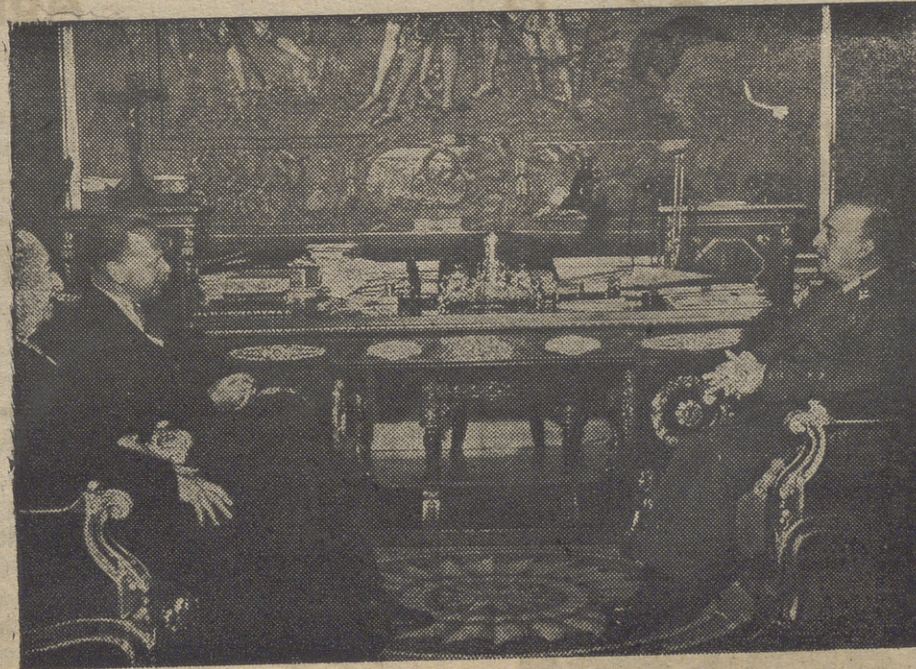
Un momento de la audiencia concedida por Su Excelencia el Jefe del Estado a Mr. Hommarskjold, secretario general de la O. N. U., acompañado del embajador español en dicho organismo Internacional, señor Lequerica.