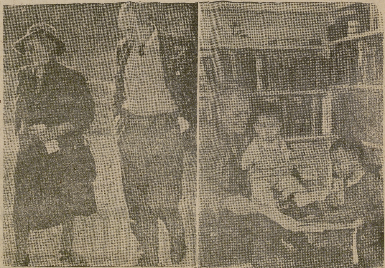
Pearl Buck, la novelista más leída del mundo, está en Europa, Pearl Buck, que ha adoptado siete niños y educa otros ciento cincuenta, durante su estancia en París se entrevista con los organizadores de una función en favor de las víctimas de Hiroshima. Pearl (a la izquierda de la primera foto) ha prometido al escritor Ira Morris, lanzador de la idea, su colaboración más entusiasta. La otra fotografía represento una escena familiar de Pearl Buck que se entretiene en su casa con dos de sus hijos adoptivos.