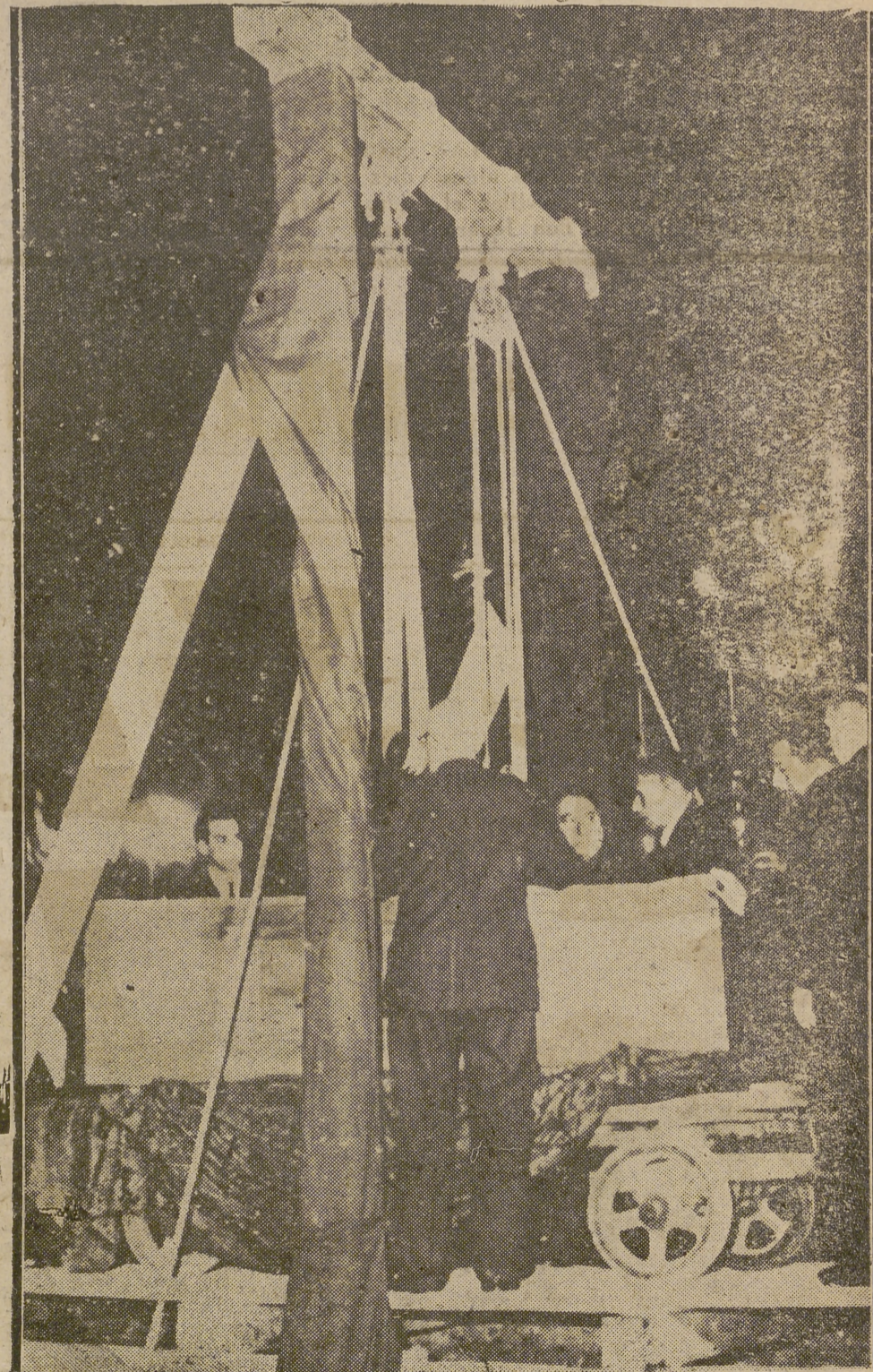
El lunes por la tarde se celebró en Roma el ségundo de las misas de duelo de Santo Padre. Millones de católicos de todo el mundo estuvieron presentes en los receptores de radio, siguiendo paso a paso, la incolorante ceremonia. Muchos corazones lloraron... El cuerpo del Papa Pío XII desceroló est al sepulcro; pero su espíritu queda en nuestros auras y lo primero manifestará se la ce producir espléndidamente mañana, «Domund de Pío XII»