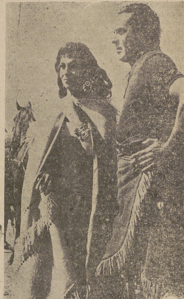
En la zona desértica de Valdeespartera (Zaragoza) se «ruedan» los exteriores de la producción norteamericana «Salomón y Saba», que dirige el prestigioso realizador King Vidor. Gina Lollobrigida, en el papel de la reina Saba, y Tyrone Power (Salomón), aparecen en la foto de Cifra durante una pausa en la tarea.