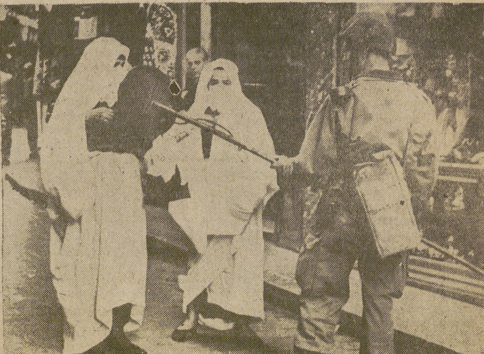
En Argelia, la policía francesa ha sido dotada de unos aparatos especiales para controlar el contrabando de armas. La fotografía recoge a un policía haciendo uso del detector.