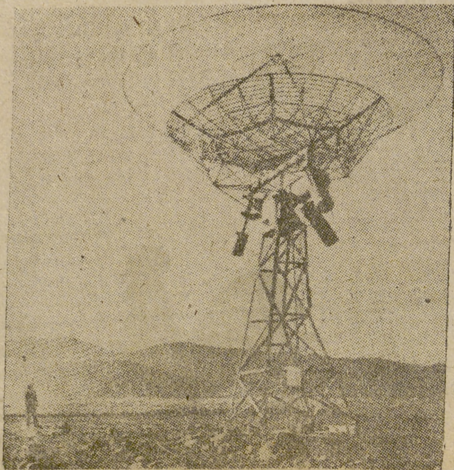
Uno de los más perfectos aparatos de radar del mundo es el del Laboratorio de Boulder (Colorado). Proporciona datos minuciosos y valiosísimos sobre la marcha de los Sputniks.