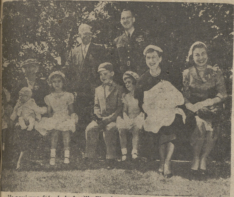
He aquí una foto de la familia Eisenhower. En ella aparece el Presidente rodeado de su esposa, hijo, comandante Eisenhower, hija política y nietos