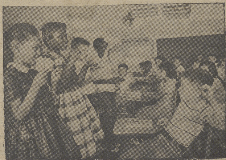
En la clase de ciencias de la Escuela Primaria de Tynam, en San Antonio (Tejas), niños de color, mezclados con los blancos, muestran a sus compañeros de clase los distintos estados por los que pasa el copo del algodón desde la planta hasta que está listo para su industrialización como tejido.