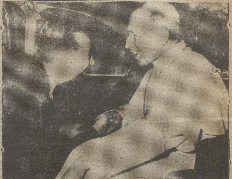
En Santua el Papa Pio XII recibe la bienvenida del alcalde de Castelgandolfo, Marcello Gosta, a su llegada a su residencia de verano, donde permanecerá hasta noviembre próximo.