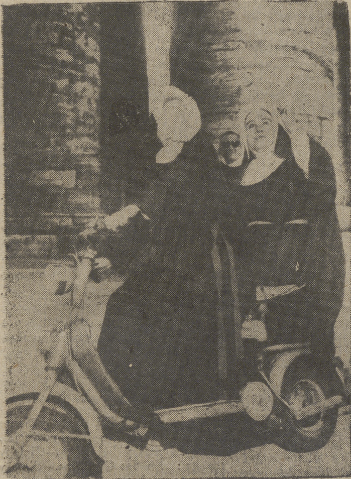
Estas dos monjitas en su «scooter» han constituido un espectáculo muy poco frecuente, aun en Roma, donde todo el mundo viaja en esta clase de vehiculos. En la fotografia aparecen al pie de las columnas de San Pedro.