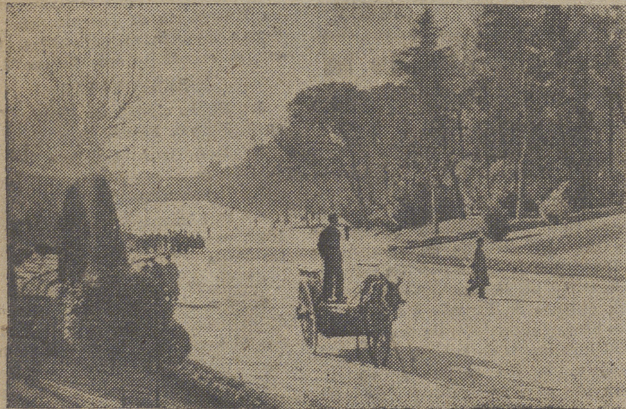
5) Bajo la paz de Franco

«Sigue la alta temperatura...» «Continúa el calor sofocante...» «Extraordinariamente caluroso ha sido...» Poco más o menos, este era el texto de los centenares de telegramas que se amontonan en los periódicos. Cuarenta y dos grados y medio a la sombra en Ecija, 40 a la sombra en Peñarroya, 52 al sol en Córdoba y ¡54 al sol! en Las Palmas. Un compañero habla, como es natural de «la sartién de Andalucía». Otro quiere huir a Oviedo, donde el termómetro marcaba a mediodía la deliciosa temperatura de 20 grados. Un tercero pide el botijo.