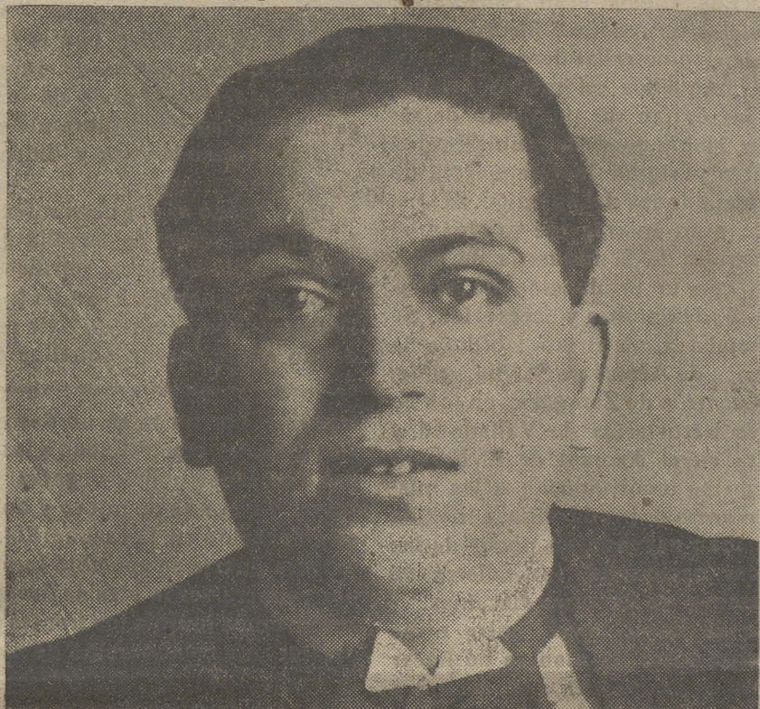
Don José Calvo Sotelo

«Pedimos una revolución; pero la rusa no nos sirve como modelo, porque necesitamos llamaradas gigantescas que se vean en todo el planeta y oleadas de sangre que enrojecen los mares».