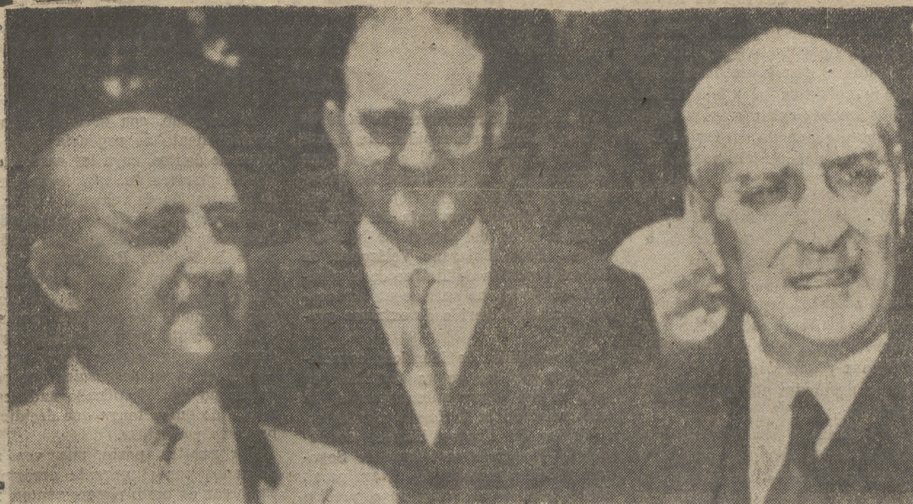
Todos los éxitos de nuestro invicto Caudillo en las relaciones internacionales tienen su punto de partida sin duda alguna en la extraordinaria visión de unidad hispano portuguesa conocida con el nombre de Bloque Ibérico, confirmada en la reciente entrevista FRANCO-OLIVEIRA SALAZAR, en Ciudad Rodrigo, a que se refiere la fotografía.

El futuro de España, ha dicho el excelentísimo señor ministro subsecretario de la Presidencia del Gobierno, está perfectamente claro, porque en España perdurará para siempre la gran creación del Caudillo: el Movimiento Nacional.