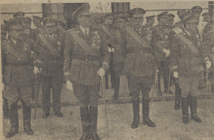
2) El Ejército español...

Taller de reparaciones de máquinas de escribir, sumar y calcular