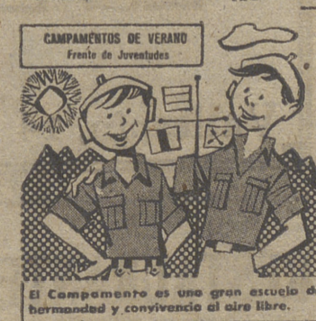
CAMPAMENTOS DE VERANO Frente de Juventudes