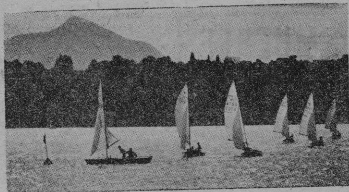
Ginebra. — Momento de montar una baliza en la primera prueba del Campeonato Mundial de Snipes. — En primer término el balandro de los EE. UU. que debía resultar vencedor en todas las regatas celebradas y conseguir el título máximo.