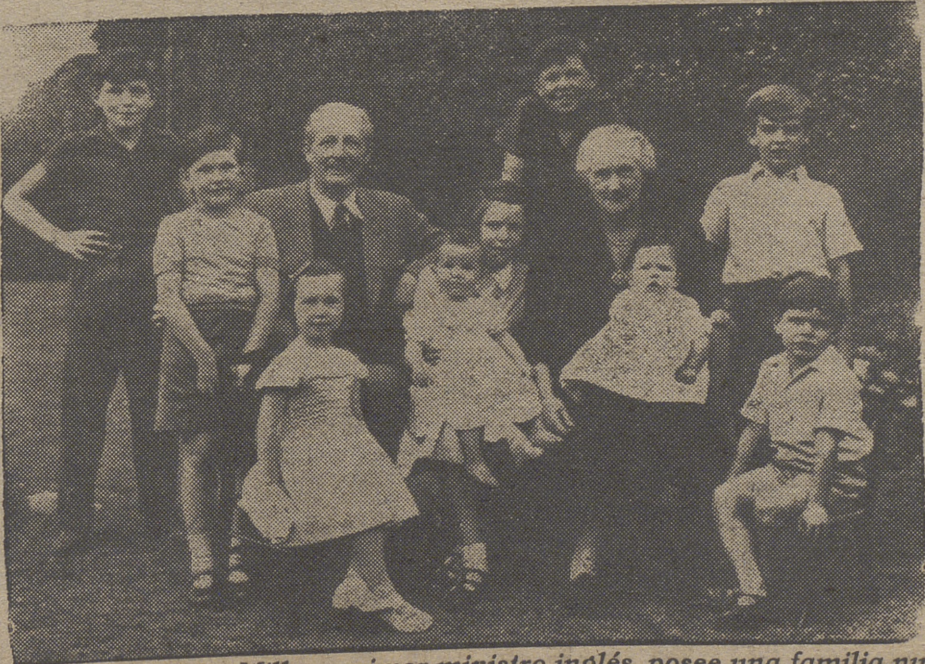
Mr. Harold Mac Millan, primer ministro inglés, posee una familia numerosa, contando en ella a sus nueve nietos. Esta fotografía fué obtenida en agosto último en Chelwood Gate, Sussex. Desde entonces hay que añadir dos nuevos nietos a la familia del «premier» británico.