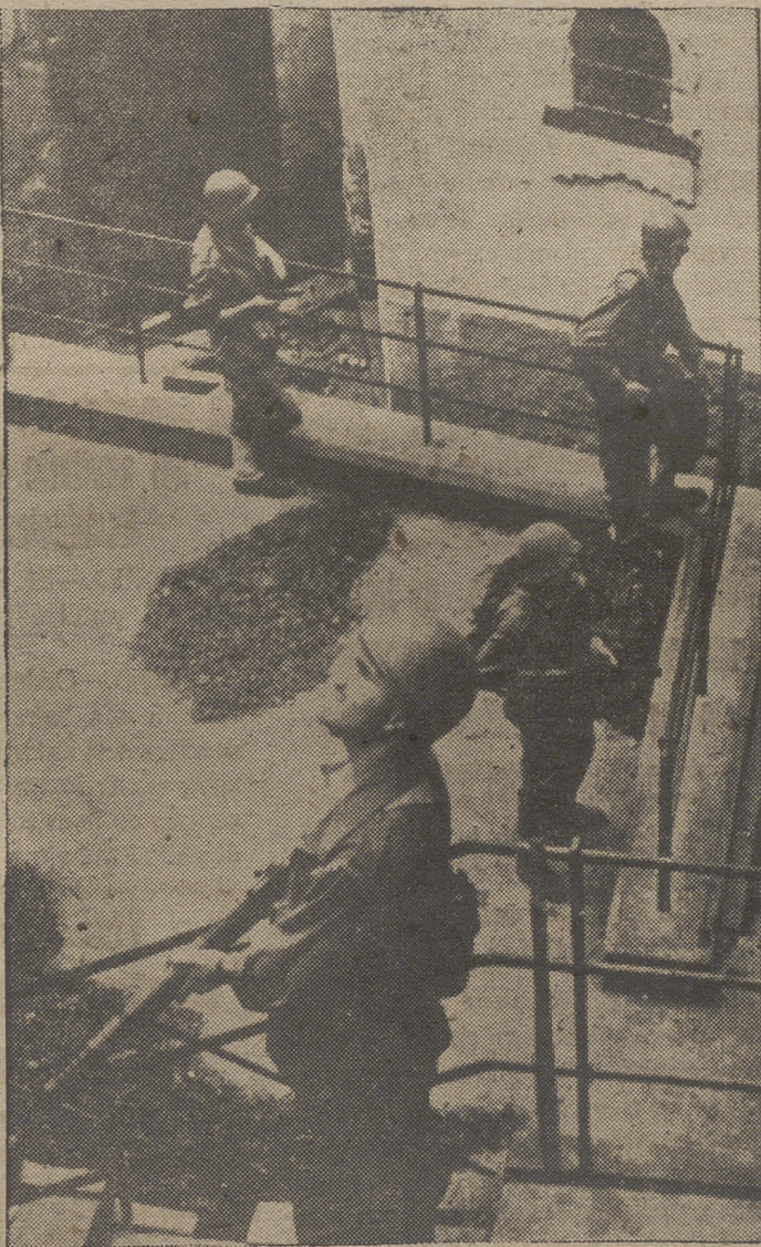
En esta fotografía de Cifra Gráfica, aparecen unos soldados franceses durante las operaciones de control y registro que ha ordenado el general Massu. Este general ha sido encargado de mantener el orden y la seguridad en la región argelina.