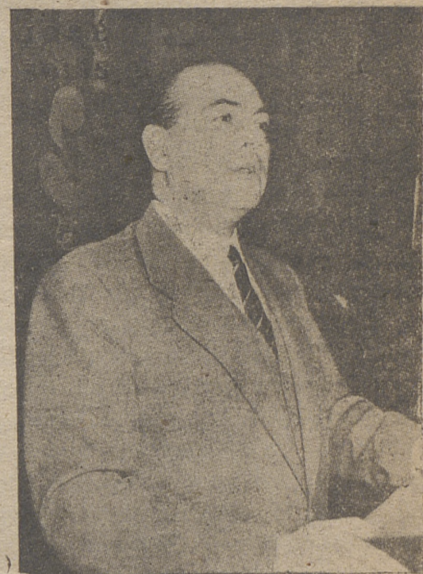
El excelentísimo señor don José Solís Ruíz, que ha presidido esta mañana los actos conmemorativos del Día de la Falange de Avila