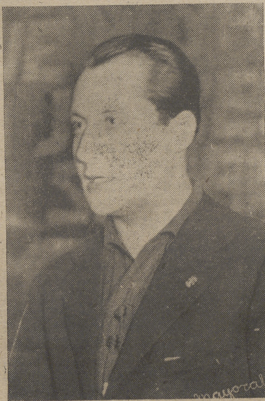
Esta fué la noble y viva expresión de José Antonio en Avila captada por Mayoral y destacada de una fotografía que es familiar para los abulenses con toda la presidencia del acto del Teatro Liceo en 1936.

petúa la estancia de José Antonio en nuestra ciudad. Concluyó este acto cantándose el «Cara al Sol».