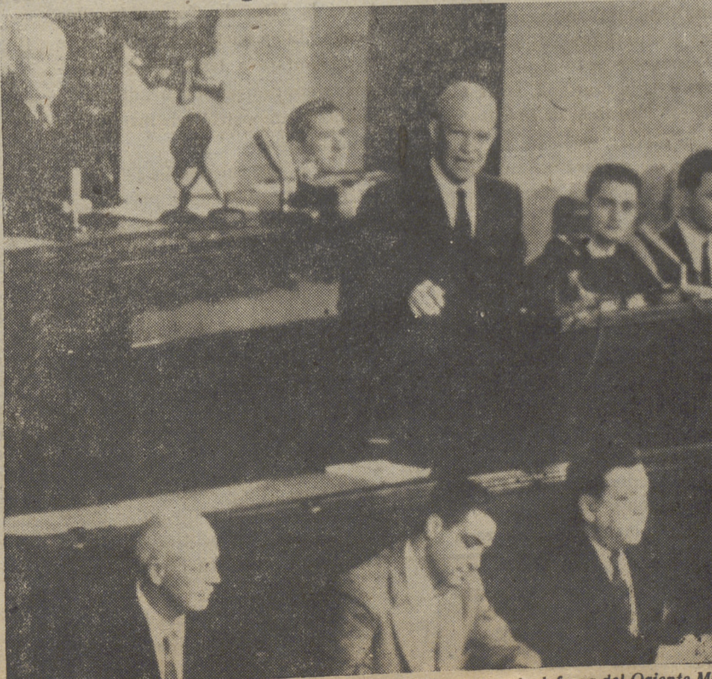
El Presidente Eisenhower durante la exposición de su plan para la defensa del Oriente Medio en caso de agresión comunista. Detrás aparecen Nixon y el locutor de la Cámara.