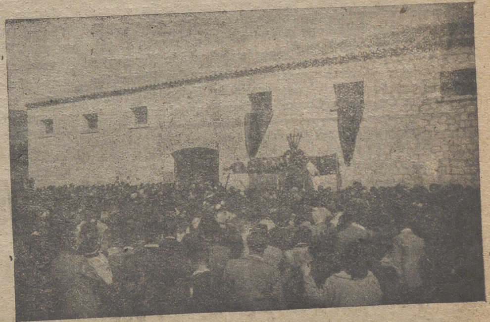
y otra importante realización, también cebrereña, es la Bodega Sindical, que ha despertado en los pueblos de la zona vinícola un afán de emulación laudabilísimo.