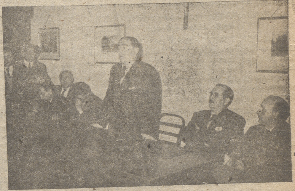
Las actividades sindicales alcanzan a todas las manifestaciones de la vida: el orden cultural, el orden económico, el orden social... Estas fotografías se refieren a tres momentos distintos correspondientes a otras tantas realizaciones de la C. N. S. entre las más recientes celebradas.

Nos queda, pues, el expresar el deseo de que en esta labor sea fecundo el año que acaba de empezar y verdaderamente feliz para todos los nacionalsindicalistas abulenses.