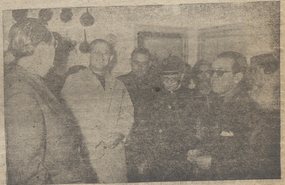
el Prelado diocesano, Gobernador civil, Secretario de la Obra Sindical de Colonización, Delegado provincial de Sindicatos y autoridades de Cebreros en la visita a las viviendas del Grupo «Nuestra Señora de Valsordo», uno de los construidos en la provincia por la Obra Sindical del Hogar, en el año 1956;

El jefe provincial del Movimiento y gobernador civil pronuncia la lección de apertura de curso en la Academia Sindical;