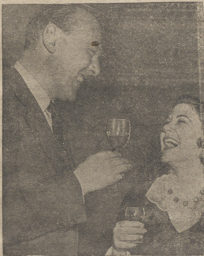
En esta fotografía se ve a Lord Lloyd, subsecretario del ministerio británico de Colonias, y a la señorita Droussoula Demetriades, de Nicosia, saboreando un vaso de vino de Chipre. La quinta parte de la agricultura de dicha isla está relacionada con la industria del vino