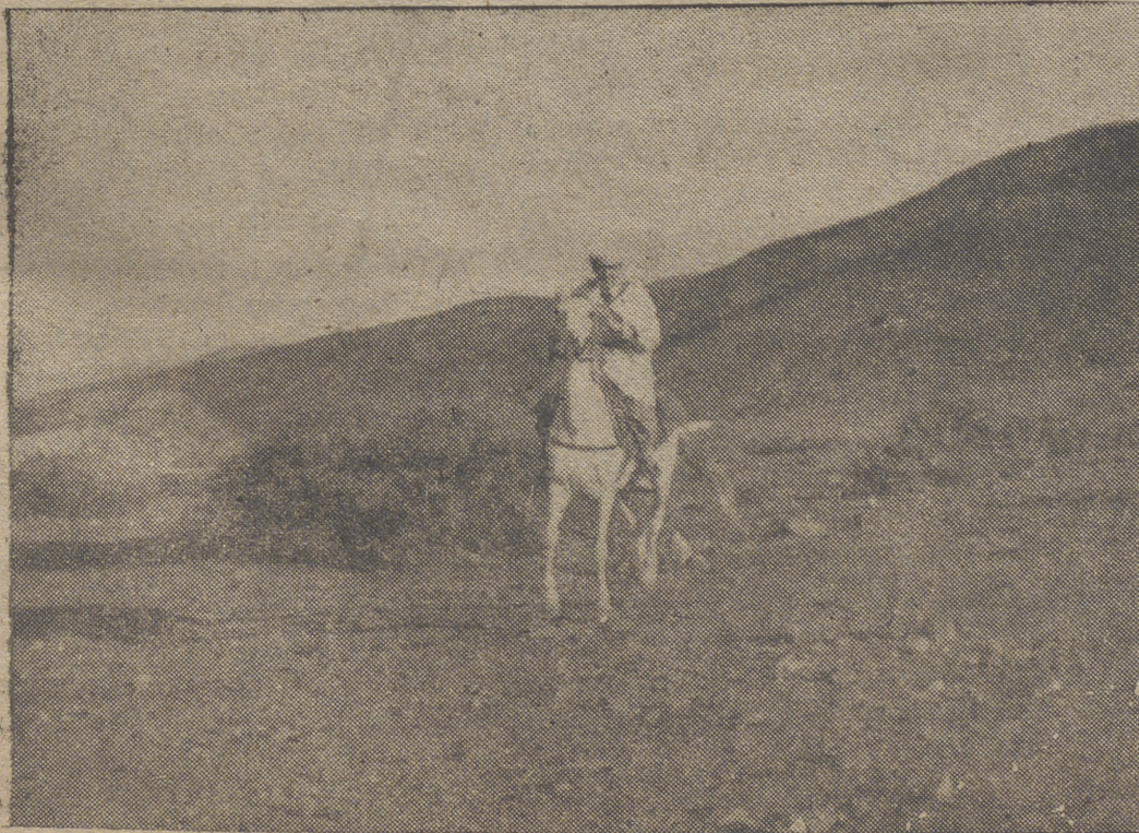
La guerra que no se conoce, mal endémico, es la de los guerrilleros argelinos con ideal de independencia. Las noticias de hoy señalan una dura batalla en Mascara, sangrienta represión en el Camerón francés, muerte del suegro del jefe del Gobierno de Rangún, diez y nueve muertos en atentados y veinté nacionalistas muertos por la Policía francesa en el Camerón