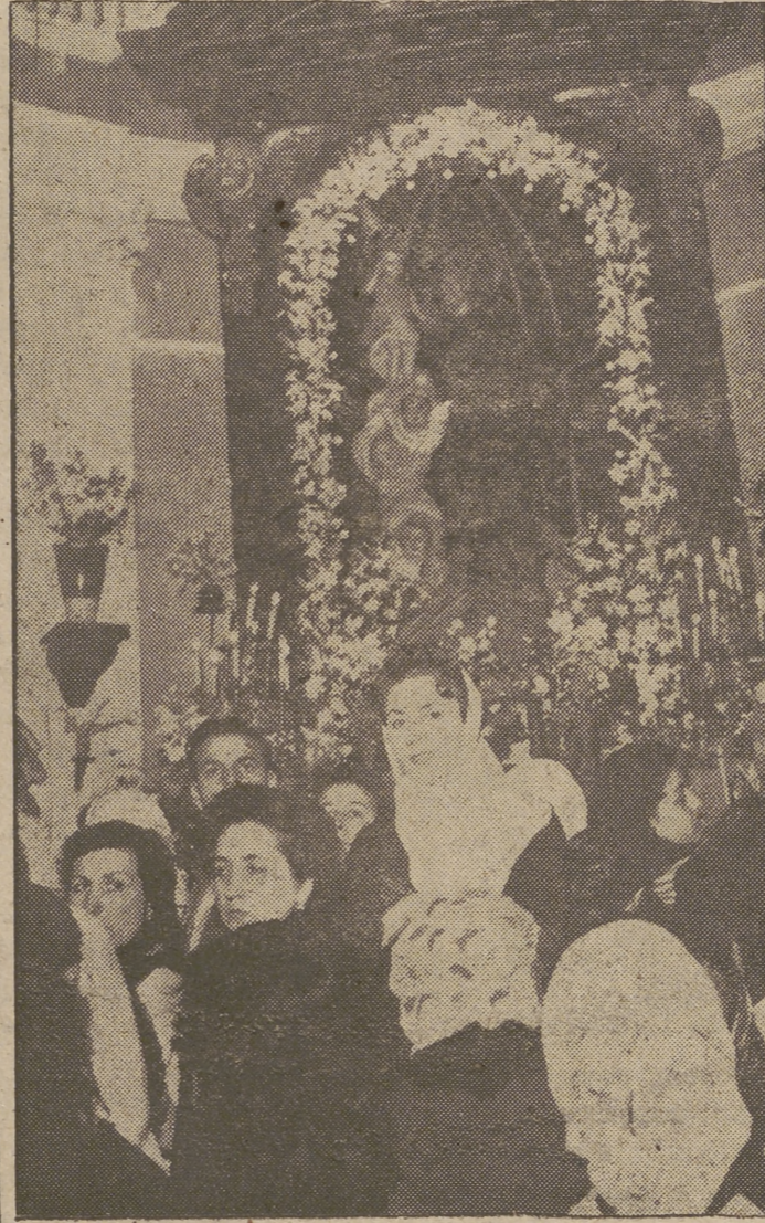
«Todos los años, en la fiesta de San Antonio, Madrid inicia su período verbenero. Ayer la ermita de San Antonio de la Florida, fué visitada por numerosísimo público entre el que destacaban las simpáticas modistillas que van a encomendarse al Santo con fervor como esperanzas de futuro.»