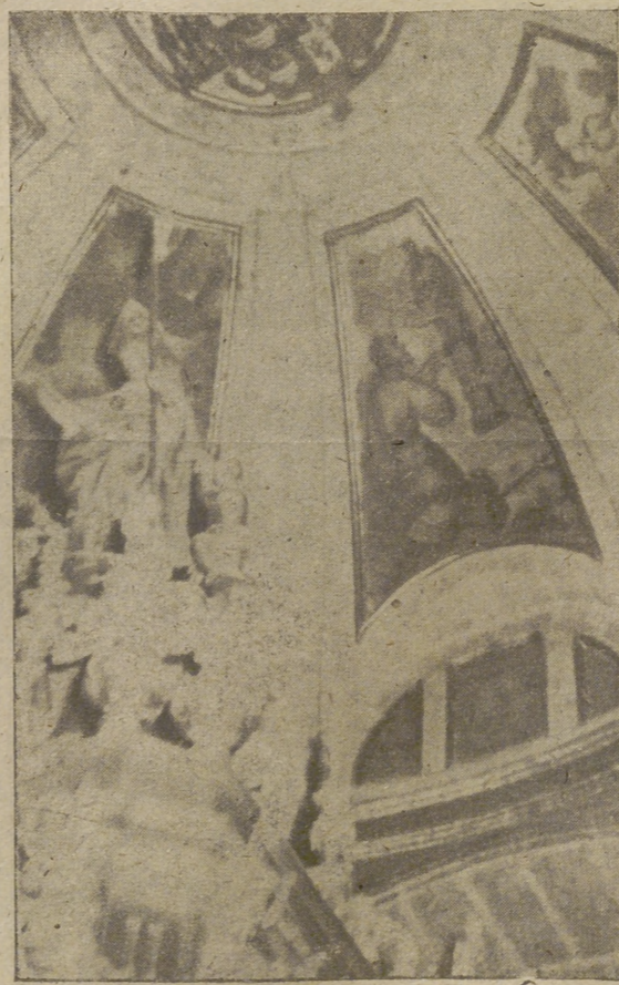
La visita de la Santísima Virgen en carne mortal a Zaragoza se representa en la cúpula de la Capilla de San Segundo.

La Capilla de San Segundo, adosada a la Catedral es ciertamente linda y esbelta: monumento renacentista, su exterior presenta debajo del frontón triangular lo que debió ser proyecto de portada, que anuló la que se alza sobre las escalerillas. Al interior se halla decorada con pinturas murales al fresco, de las cuales hay unas que se refieren a la