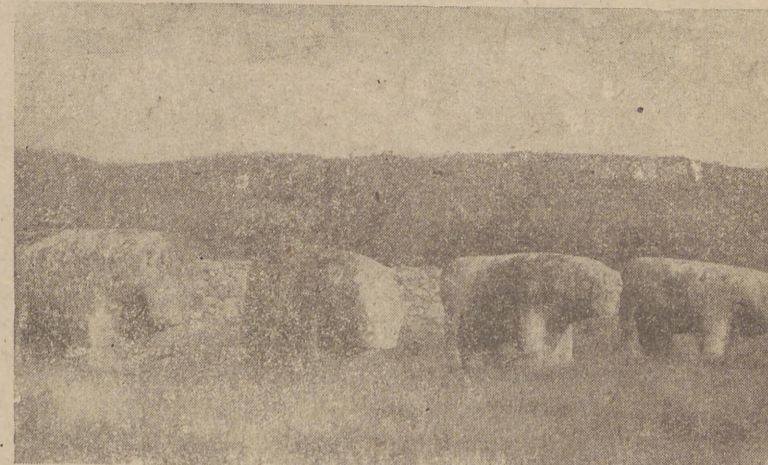
Los toros de Guisando