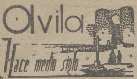
Coplas de actualidad

Mi limpiabotas, mi sastre y mi barbero, el chico que abre las puertas en el café y en la oficina, el otro que barre el suelo, los porteros, las criadas, el del vino, el barrendero, el sereno, el de los ultramarinos, el que vende los sombreros, los fumistas, albañiles, el hojalatero, el chico de la farmacia, los mancebos de las tiendas de escritorio donde como pro los objetos, la estanquera, sus dos hijos y los nietos, tres monaguillos, dos hombres a quien compré dos quesos, mi callista, sus hermanas y cuñadas y su abuelo y hasta un joven que una tarde hallándome en el paseo porque estornudé a su lado: «Jesús, caballero! me han pedido el aguinaldo con más frescura (que el tiempo) pero como ya estoy harto de soportar pedigrifos y además por mi desgracia no dis pongo de dos perras, las he contestado a todos... ¡que me alegro verles buenos!