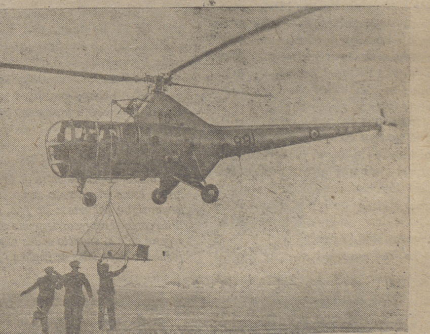
Para transporte de enfermos o heridos, se han realizado pruebas con una nueva litera, parecida a las ordinarias pero tiene un armazón de acero tubular con lados de lona para proteger al paciente contra el viento. Puede ser izada por medio de un helicóptero

Lección cristiana del fracaso de Ginebra «L'Osservatore Romano» indica que el fracaso de la conferencia de ministros de Asuntos Exteriores en Ginebra ha abierto el camino a los hombres de fe religiosa para reavivar el «espíritu de Ginebra» sobre una base más sólida. Añade que la conferencia mostró un retorno al lenguaje de la guerra fría. Votarán a España Los periódicos neoyorquinos publican en forma destacada una información enviada por el director en España de la agencia United Press, Ralph E. Forte, en la que dice que los Gobiernos norteamericano, británico y francés votarán a favor del ingreso de España en las Naciones Unidas. «En los círculos españoles se dice—señala la información—que el ingreso de España, Italia, Por-