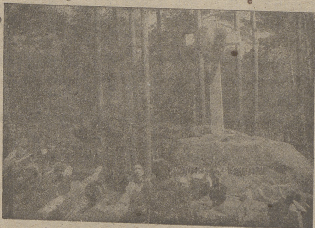
Sobre la Peña Histórica de Gredos se alza la Cruz. Recuerdo espiritual de la presencia física de José Antonio en tierras abulenses.

Más difícil tarea que enterrar a los muertos es mantenerlos en devoción respetuosa y fiel. Porque de los muertos, de aquellos que de los muertos nos resulta perceptible—la presencia física, y el rastro espiritual—perdemos el contorno, la configuración verificable, el límite preciso que cuando viven, cada día se confirma aun si se rectifica a nuestra vista. Cuando el muerto se nos va todo él se nos escapa de las manos, del corazón, del pensamiento como en un violento empeño del finado de reducirse a podredumbre y olvido. La muerte de nuestros muertos viene a ser no un hecho sino una situación progresiva que se cumple inexorablemente con susto, dolor y escándalo de quienes les vemos ir lentamente despareciendo primero del dolor, luego de la nostalgia, finalmente del recuerdo.