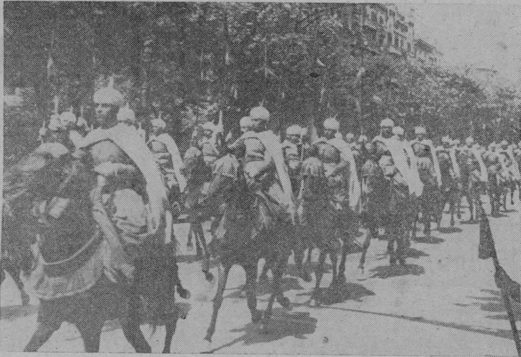
Un interesante momento del gran desfile militar celebrado en Barcelona ante S. E. el Jefe del Estado.