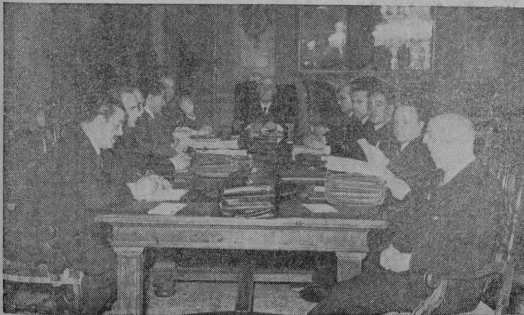
La foto recoge una instantánea del Consejo de Ministros celebrado en Barcelona el viernes pasado bajo la presidencia de S. E. el Jefe del Estado