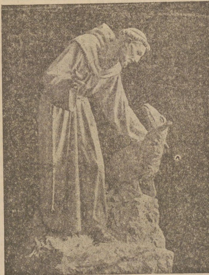
Siguiendo las huellas del glorioso Fundador, la Orden Franciscana pide, a quien lo tiene, pan y abrigo para el que carece de ello. En esta festividad acuérdense los pudientes del comedor de niños pobres del Convento de San Antonio que vive... de las deudas, como con gracia señala el padre... Mas como toda deuda pagada aumenta los créditos, tomemos acciones en este negocio con garantías de pobreza y verdad, y que no se cierre ese comedor donde se sazona el pan con Catecismo.

tean nuestro culto y vivir diario. Lo que pasa, con respecto al comedor, es que son muchísimos los que le desconocen.