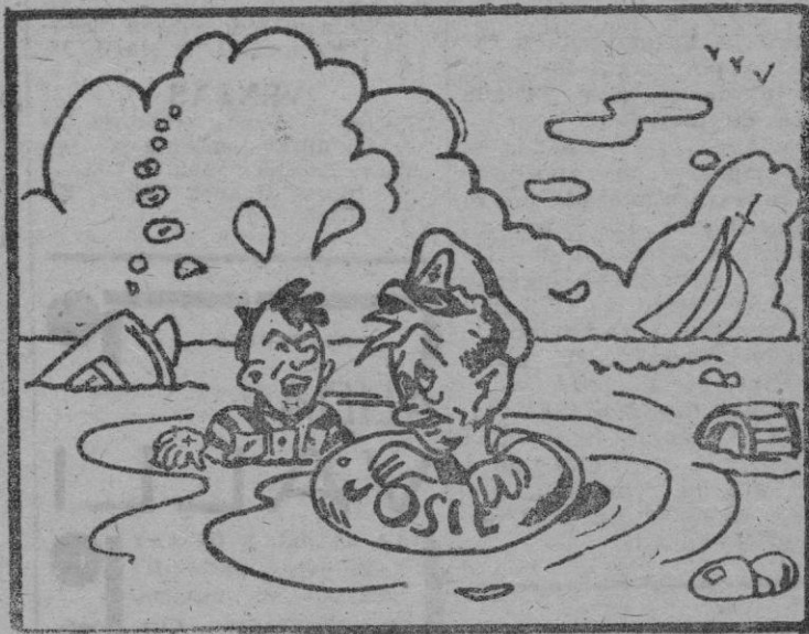
¿Y TODAVIA NO ESTAS CONVENCIDO QUE UNA VELA DE 100 METROS CUADRADOS ES DEMASIADO PARA UN BOTE DE 5 METROS? (De «The Rudder»)

Cuando estas líneas aparezcan, las embarcaciones que tienen que tomar parte en las