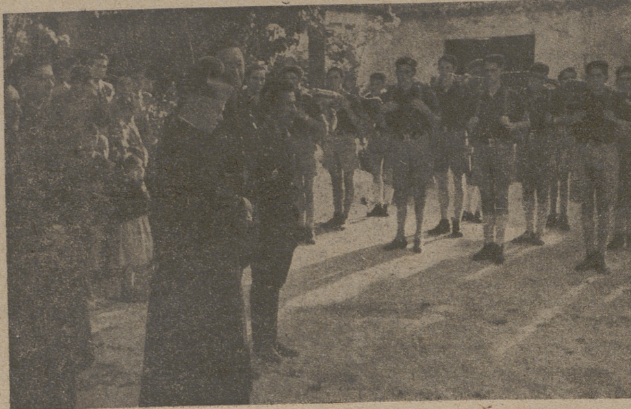
El excelentísimo y reverendísimo señor Obispo dirige la palabra a los peregrinos del Frente de Juventudes, presididos por el delegado provincial, secretario, capellán, ayudante de las Falanges Juveniles e instructor, en la víspera de la partida para el Congreso, dándoles su bendición pastoral

Desde el primer día en que se inició la organización, la Delegación Provincial, además de pro-