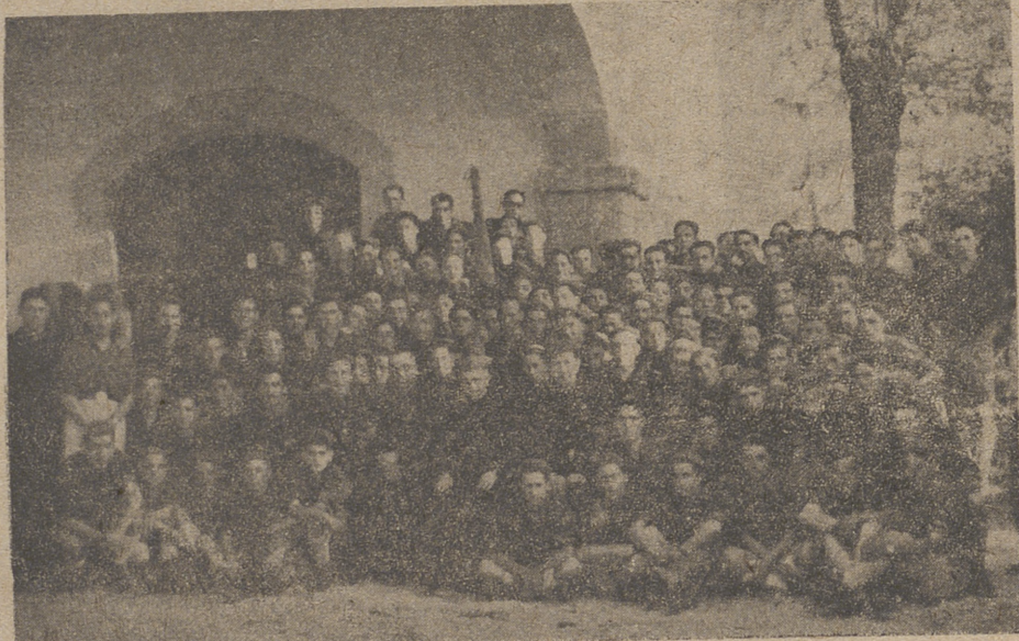
La peregrinación de las Falanges Juveniles de Franco, que ha asistido al Congreso Eucarístico, con el excelentísimo y reverendísimo señor Obispo y mandos provinciales, en el acto de despedida.

Oportunamente dimos cuenta del feliz viaje, llegada y estancia de estos muchachos en Barcelona, congratulándonos de publicar su salida sin novedad para nuestra capital y deseándoles que los bienes espirituales conseguidos les sean perdurables y se multipliquen a toda la organización.