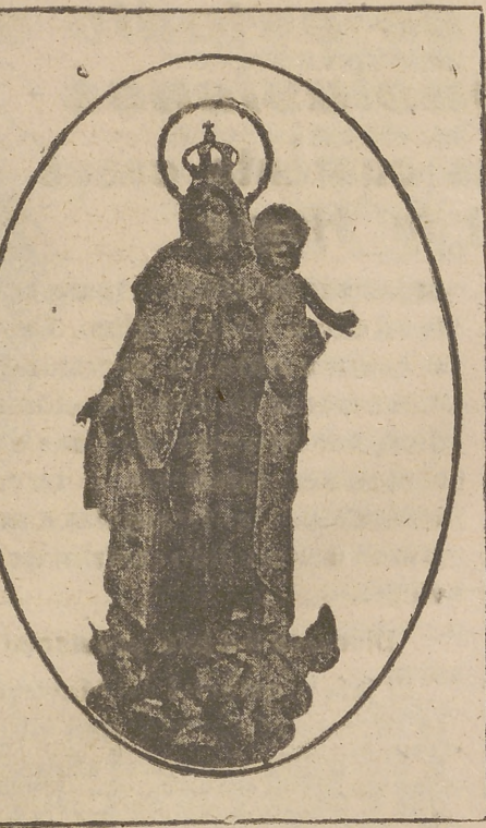
La Virgen del Carmen.

La impresión predominante no puede ser más halagüeña, creyéndose que este año no habrá resaca. Y si las hay, habrá de ser solamente en alguna de las