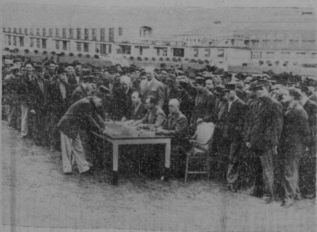
Ochocientos penitenciaros de Stateville III, firman los contratos por los que ofrecen sus ojos para que después de su muerte puedan ser estudiados y utilizados por los médicos, para contribuir así a que muchos ciegos puedan recuperar la vista.