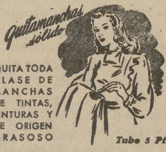
QUITAMANCHAS CLASE DE MANCHAS DE TINTAS, PINTURAS Y DE ORIGEN GRASOSO

ALICANTE, 7.—El gobernador civil, ha realizado una visita al pantano en construcción de Beniarres. Este pantano quedará terminado en un plazo de dos años. El Estado ha aportado el 80 por 100 de los 36 millones de pesetas en que se calcula su coste y el 20 por 100 restante corresponde al Sindicato de Riegos de Alcoy. El embalse, sin alzas, tiene una capacidad de ocho millones de metros cúbicos, pero con los recrecimientos podrá alcanzar la cifra de 24 millones.—(Cifra.)