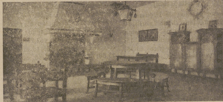
Interior de un Hogar Rural

Habitaciones con agua corriente caliente y fría, moderna galería de baños. 1.º de julio a 30 de septiembre. (C. S. 3.804).