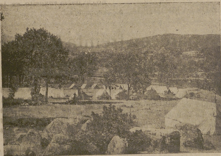
Vista general del Campamento

toria y el por qué de nuestra revolución, acaudillada por Francisco Franco, se aprende, mejor que en ninguna otra aula, junto a los bosques y sobre las montañas, teniendo por marco soberbio a la Naturaleza, de camarada a camarada que «ser español es una de las pocas cosas serias que se puede ser en la vida».