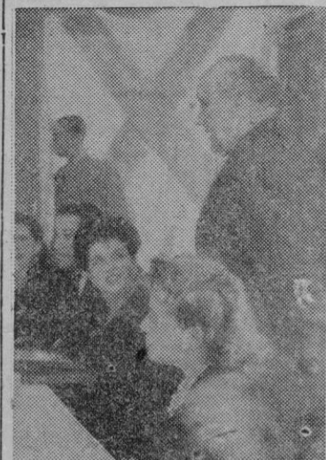
El Almirante durante el breve discurso que pronunció.

En la regata de ayer tuvieron que retirarse para averías