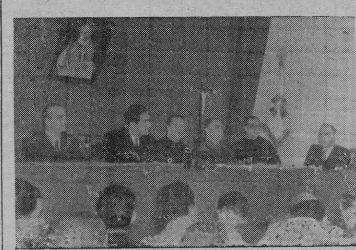
Detalle de la presidencia de la sesión celebrada ayer por la mañana en el local social de la A. C.

EN LAS ELECCIONES DE AYER VOTARON MUCHOS QUE NO PARTICIPARON EN ANTERIORES VOTACIONES París, 10. — Los funcionarios del Gobierno declaran que, en muchos distritos de París se han visto hoy numerosas tarjetas de elector que aún no habían sido tachadas, es decir, cuyos titulares no habían hecho hasta