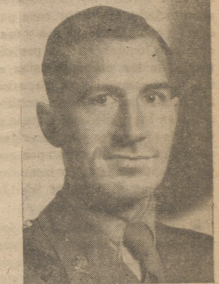
El Major Christopher Pager Mayhew, subsecretario parlamentario en el Ministerio de Asuntos Exteriores. En el año 1940 dejó el ejército para incorporarse en el Ministerio de la Guerra Económica. En el año 1942 ingresó nuevamente en el Ejército hasta 1945 que entró de secretario privado parlamentario con el lord presidente del Consejo

La comitiva se pondrá en marcha, camino del palacio nacional, donde se celebrará el acto, desde el hotel Ritz, donde se hospeda el embajador argentino, quien será escoltado por la guardia mora del Generalísimo.—(Cifra.)