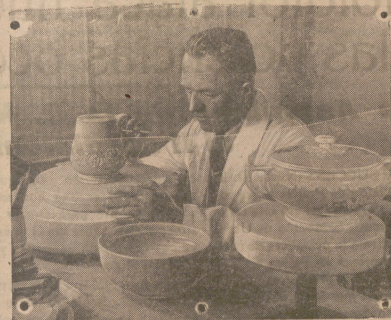
Para algunos métodos de producción se modela primero el artículo con arcilla. En esta fotografía vemos un diseñador modelando un jarrón de arcilla del cual se sacará posteriormente un molde en yeso.