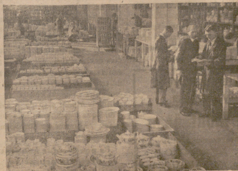
Los artículos terminados se almacenan para su inspección y embalaje. Su decoración es completamente privativa; pues cada fábrica dispone de sus propios métodos y dibujos.