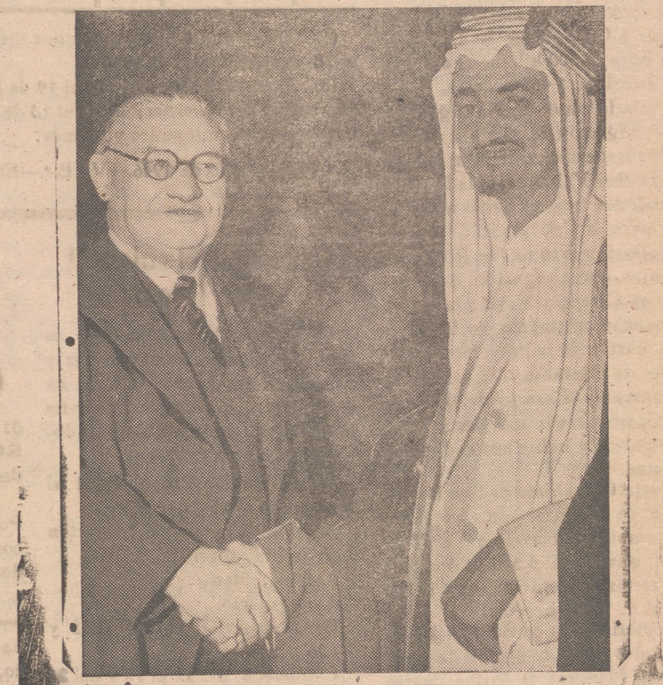
El embajador del Rey de la Arabia Saudita llega a Londres donde es recibido con toda cordialidad

También se ha solicitado que Lituania, Estonia y Letonia tengan oportunidad de elegir sus Gobiernos por medio de elecciones libres y justas. El llamamiento dice que estas naciones viven desde hace mucho tiempo bajo condiciones más duras que las impuestas por la guerra en los países satélites del Eje, tales como Rumania, Hungría y Bulgaria. —EFE.