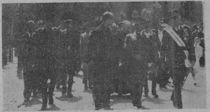
Burgos. — Su Excelencia el Jefe del Estado clausuró solemnemente en Burgos la Exposición Misional. Nuestra fotografía recoge el instante en que saliendo de dicha clausura y en compañía del General Yagüe, y del Gobernador Civil, se dirige a los campos de deportes del Dos de Mayo.