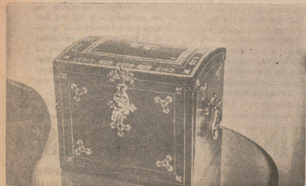
Artística arqueta que contiene los álbumes de firmas expresivas de la adhesión abulense al Caudillo de España.

Pastos ganado lanar arriéndanse temporada octubre-abril, de 8 a 11 hectáreas. Diríjase a «La Granjilla», San Martín de Valdeiglesias.