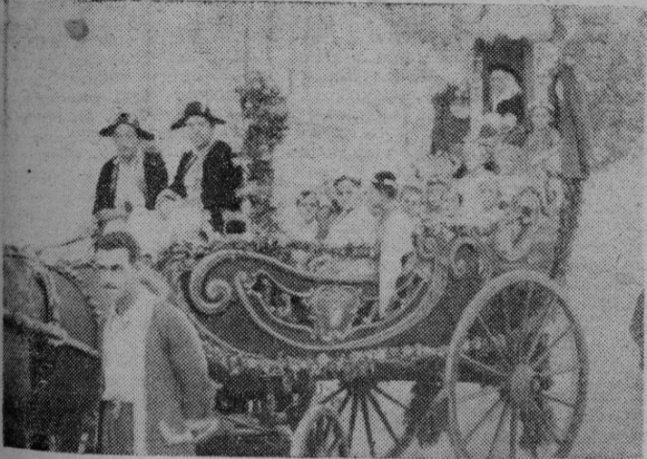
La Carroza Triunfal con la "Beateta" preparada para el desfile de anoche

organizado, la popular Cabalgata del Carro Triunfal, que recorrió las principales calles de nuestra ciudad, en extenso itinerario, durante su desfile hasta muy avanzada la noche. Su paso por las calles fue presenciado por numeroso gentío, especialmente ante la iglesia de Santa Magdalena; frente a la llamada "piedra de la Beata", adosada a la iglesia de San Nicolás, en la plaza de Santa Catalina Thomás; en el Paseo del Generalísimo