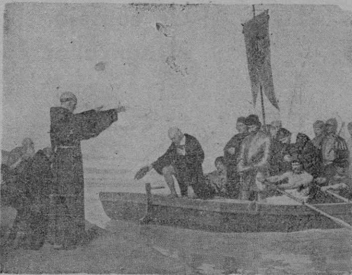
Colón al disponerse a embarcar

(Continúa al final de la primera columna de la siguiente página)